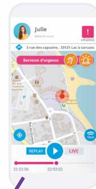
Une technologie d'alerte performante pour être localisée, écoutée et enregistrée en temps réel.

À l'occasion de la Journée internationale des droits des femmes, la Ville de Montpellier soutient App-Elles®, la première application française solidaire des femmes victimes de violence. Développée par l'association Resonantes, elle a pour but de répondre aux principaux besoins d'assistance et de soutien des victimes et des témoins, confrontés à une violence présente, passée ou potentielle. Insécurité, menaces, agressions, harcèlement de rue, violences conjugales, psychologiques et sexuelles... En cas d'urgence ou de danger, App-Elles® permet d'alerter et de contacter rapidement ses proches, les services d'urgence, les associations et toutes autres ressources d'aide disponibles à proximité.