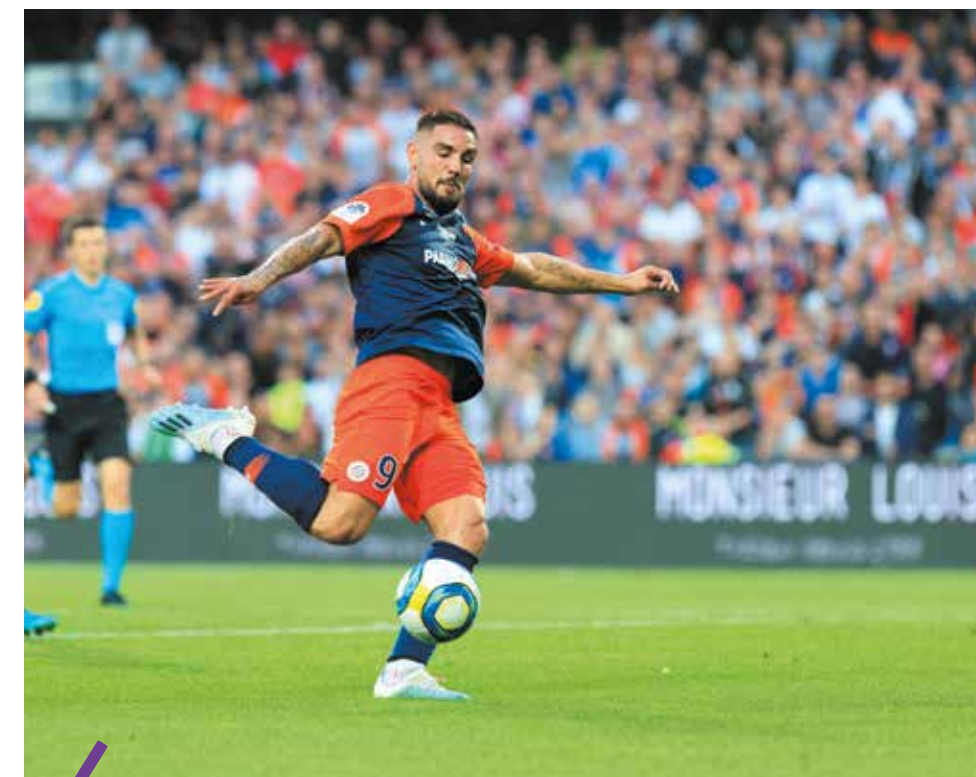
Un débat public de plusieurs mois sera engagé avant le lancement de la construction de la nouvelle enceinte du MHSC.