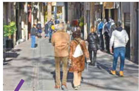
La population de Montpellier a augmenté de 1,6% ces dernières années.

Source : INSEE, recensements de la population