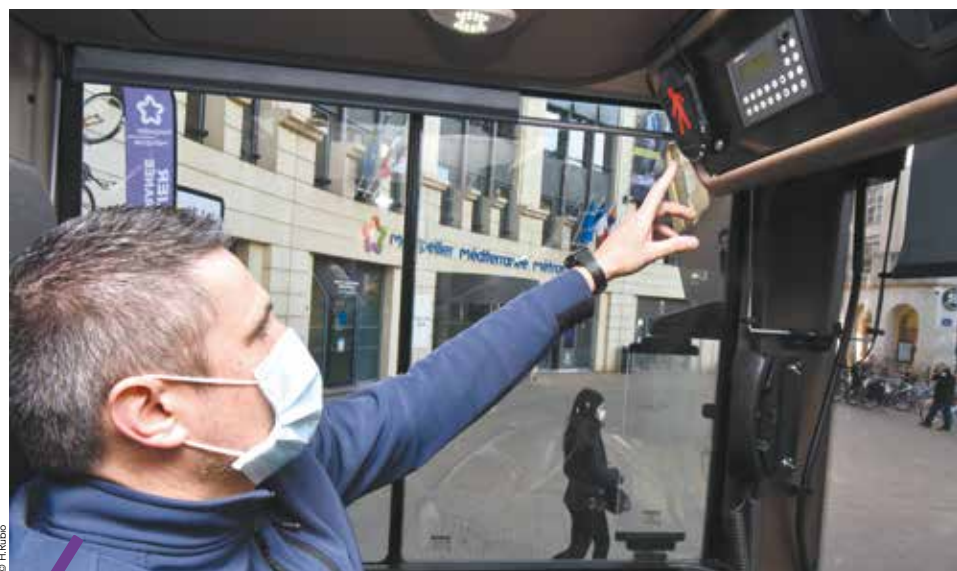
Si l'expérience s'avère concluante, elle pourrait être étendue à l'ensemble de la flotte de bus.

présidente déléguée aux mobilités. Face aux enjeux sécuritaires et à l'accroissement du vélo sur le territoire, nous avons décidé de lancer un projet pilote sur les bus TaM : l'installation d'un système d'aide à la conduite pour les conducteurs. » Une dizaine de véhicules est ainsi équipée du système Mobileye Shield+ composé de deux caméras latérales et d'une caméra frontale qui envoient des alertes visuelles et sonores en temps réel au conducteur. Un investissement de 60 000 euros pour la Métropole.