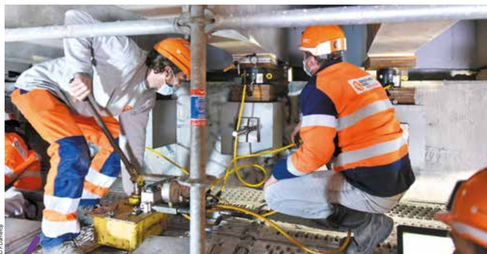
Construit en 1981, le pont de la RM 112 à Vendargues, qui franchit la RN 113, est en cours de réhabilitation pour mise en sécurité. La partie des travaux qui a un impact sur la circulation est réalisée de nuit et accompagnée d'une déviation locale. Le vérinage (photo) est une opération délicate entreprise de nuit. Il consiste à soulever le pont pour effectuer les réparations nécessaires sur les appuis de cet ouvrage d'art. Les opérateurs de l'entreprise Demathieu-Bard actionnent simultanément 30 vérins afin de le soulever de façon homogène de 5 mm par paliers de 0,2 mm... La fin des travaux est programmée pour mi-avril. D'autres chantiers de confortement du patrimoine d'ouvrages d'art de la métropole sont à venir prochainement.