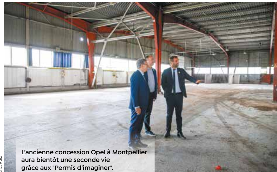
L'ancienne concession Opel à Montpellier aura bientôt une seconde vie grâce aux "Permis d'imaginer".