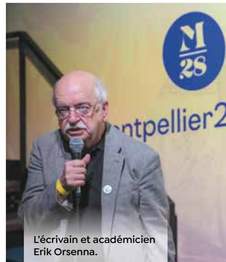
L'écrivain et académicien Erik Orsenna.