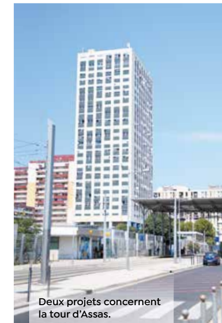
Deux projets concernent la tour d'Assas.

Quatre autres sites sont déjà retenus pour début 2023 : l'ancienne cave coopérative de Murviel-lès-Montpellier, un terrain à Prades-le-Lez, le site de l'ancien bidonville de Celleneuve et le château Leyris sur la ZAC du Nouveau Saint-Roch à Montpellier.