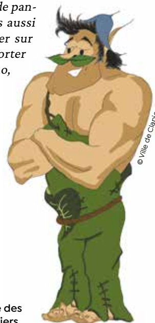
Sur la piste des Schmakroums à Clapiers.

Les amateurs de plein air, voulant échapper aux écrans ou aux tables de jeux, ne manquent pas de propositions. Comme l'espace naturel de la Vigne du Parc à Cournonterral, situé en bordure du Coulazou, prisé des promeneurs de tout âge, où la municipalité a fait installer un parcours permanent de course d'orientation. Sans oublier le jeu de piste proposé à Clapiers dans le bois du Romarin, autour de la découverte de la faune et de la flore méditerranéennes. « Un parcours à découvrir au rythme de panneaux ludiques, mais aussi de QR codes à flasher sur les bornes pour apporter un petit bonus techno, ludique et interactif. »