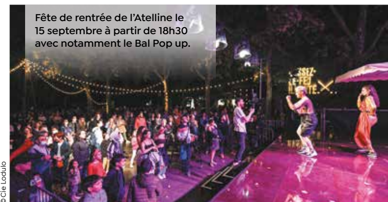
Fête de rentrée de l'Atelline le 15 septembre à partir de 18h30 avec notamment le Bal Pop up.