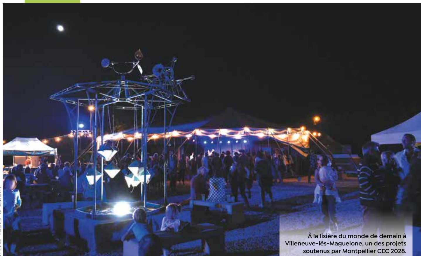
À la lisière du monde de demain à Villeneuve-lès-Maguelone, un des projets soutenus par Montpellier CEC 2028.