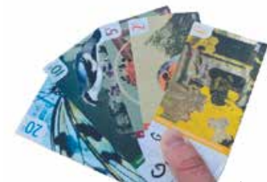
Le design des coupons a été réalisé par les étudiants des Beaux-Arts.