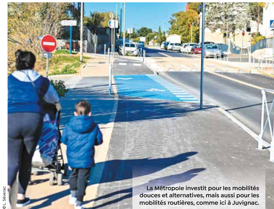
La Métropole investit pour les mobilités douces et alternatives, mais aussi pour les mobilités routières, comme ici à Juvignac.

Afin de mieux soutenir l'activité du territoire, 72 millions d'euros sont investis dans le développement économique et l'innovation. Côté sport et culture, 128 millions d'euros sont engagés pour compléter les équipements métropolitains. Par ailleurs, la Métropole poursuit son soutien aux festivals à rayonnement national et international, ainsi qu'aux manifestations culturelles dans les communes du territoire.