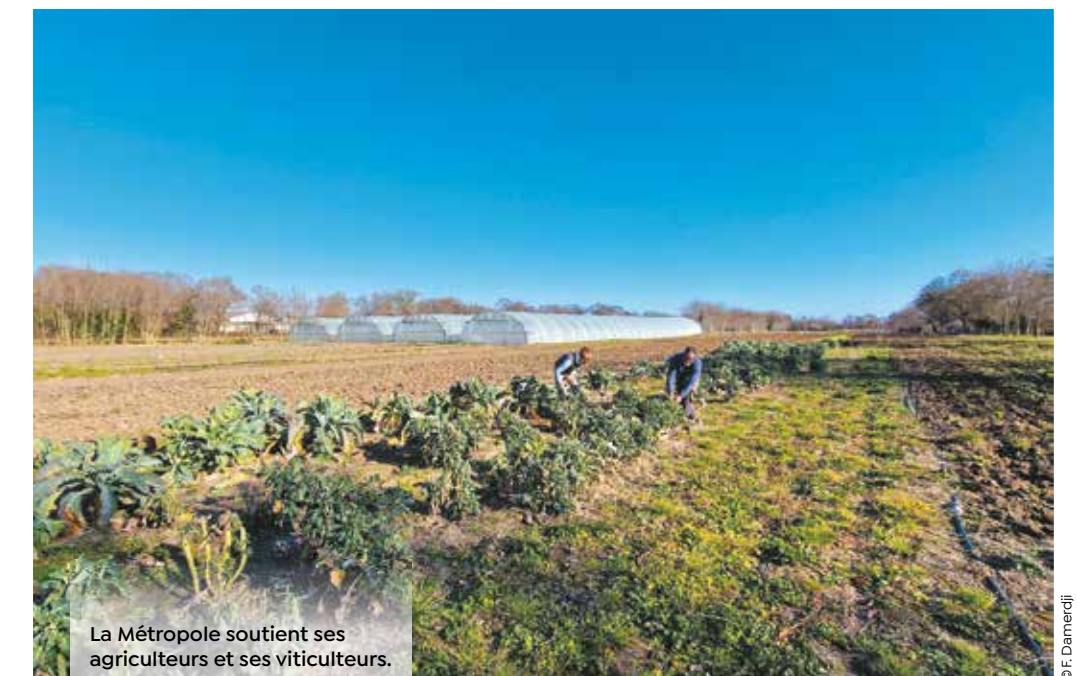
La Métropole soutient ses agriculteurs et ses viticulteurs.

alimentaire durable et équitable sur le territoire. Ainsi, 3 millions sont consacrés à l'agroécologie et aux actions foncières et immobilières agricoles. De plus, en 2024, la Métropole anticipera l'obligation légale en présentant son « budget vert ». Il s'agit d'une nouvelle classification des ressources et des dépenses budgétaires et fiscales selon leur impact sur l'environnement.