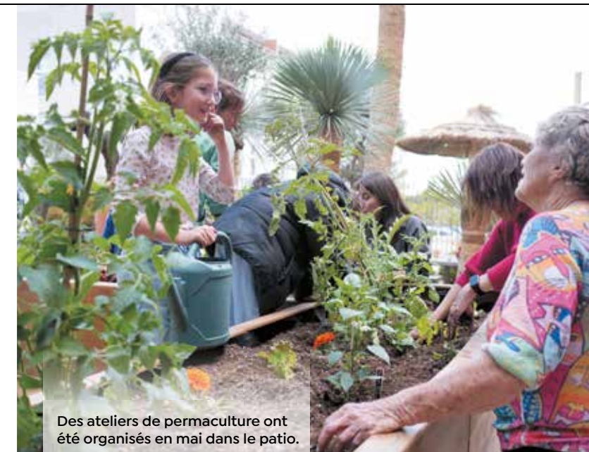
Des ateliers de permaculture ont été organisés en mai dans le patio.