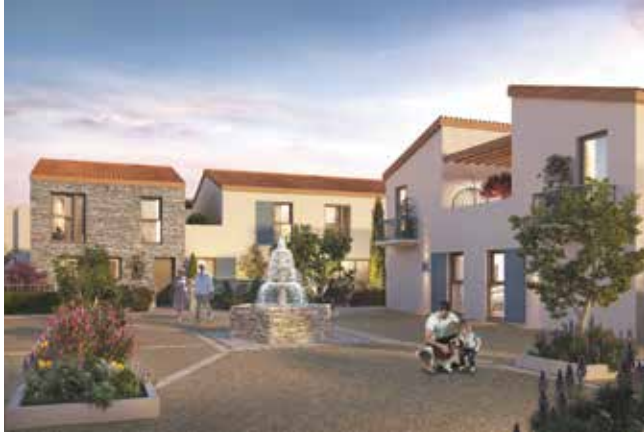
© Les Jardins de Toscane Vendargues - Vestia Terra

Énergies renouvelables, une filière en expansion dans la métropole