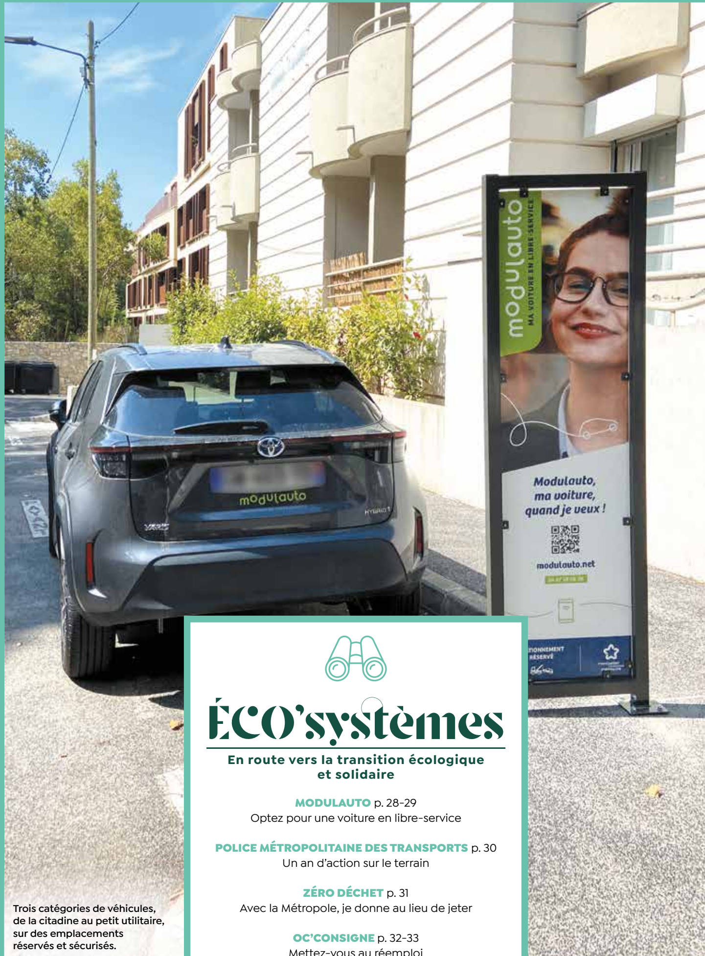
Trois catégories de véhicules, de la citadine au petit utilitaire, sur des emplacements réservés et sécurisés.