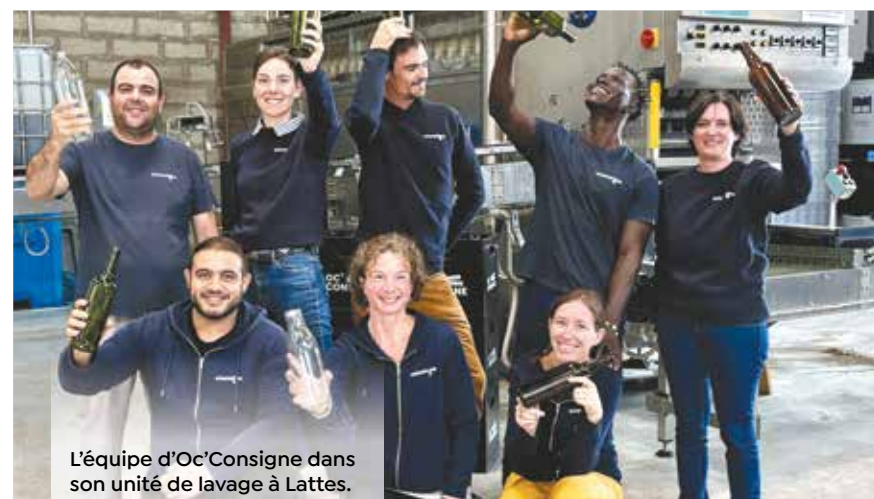
L'équipe d'Oc'Consigne dans son unité de lavage à Lattes.