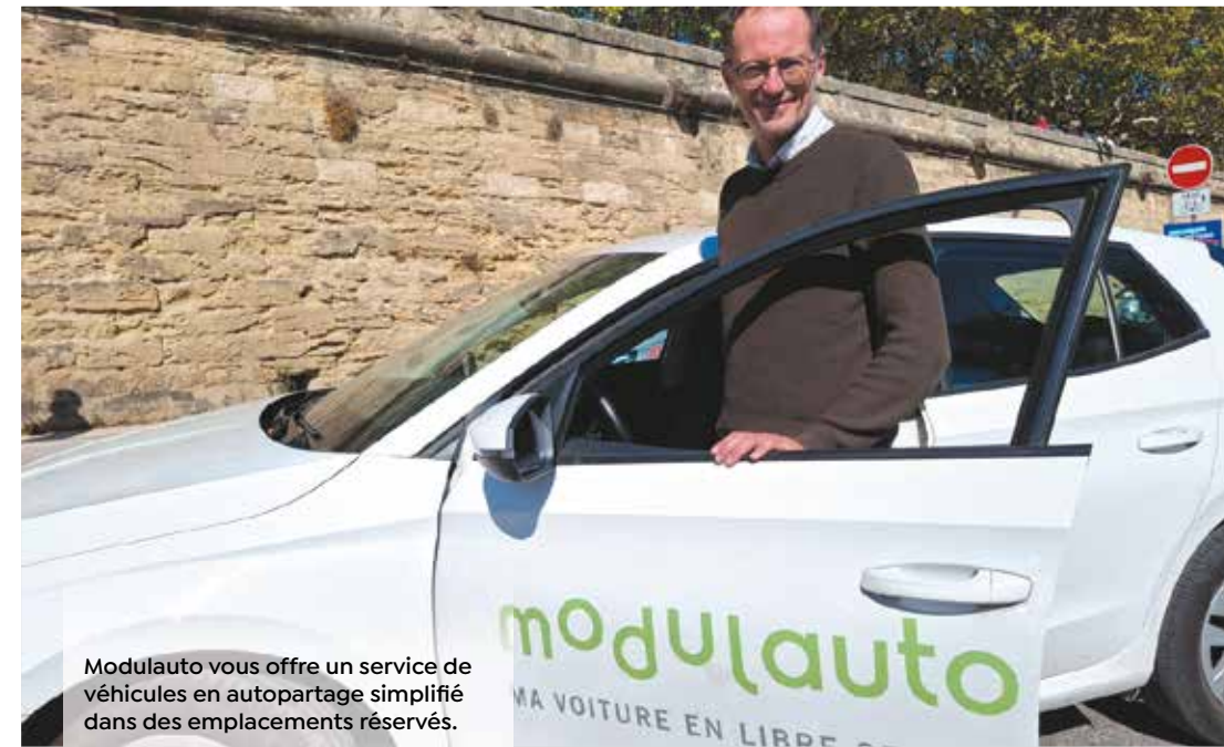
Modulauto vous offre un service de véhicules en autopartage simplifié dans des emplacements réservés.

Pour une sortie week-end, un rendez-vous professionnel, une course rapide, Modulauto met à disposition, 24 h/24 et 7 j/7, un dispositif de véhicules en libre-service à proximité de chez vous.