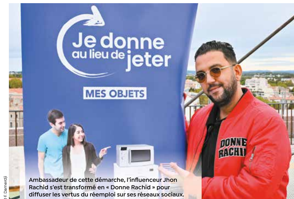
Ambassadeur de cette démarche, l'influenceur Jhon Rachid s'est transformé en « Donne Rachid » pour diffuser les vertus du réemploi sur ses réseaux sociaux.

Engagée pour la réduction des déchets, la Métropole se mobilise pour promouvoir et encourager le réemploi en mettant à la disposition de tous un outil simple et rapide sur montpellier3m.fr/jedonne . Un geste solidaire bon pour la planète.