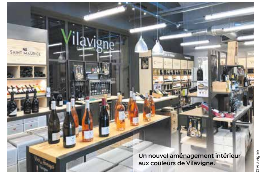
Un nouvel aménagement intérieur aux couleurs de Vilavigne.

vigneronsmd.com facebook.com/vilavignecournonsec