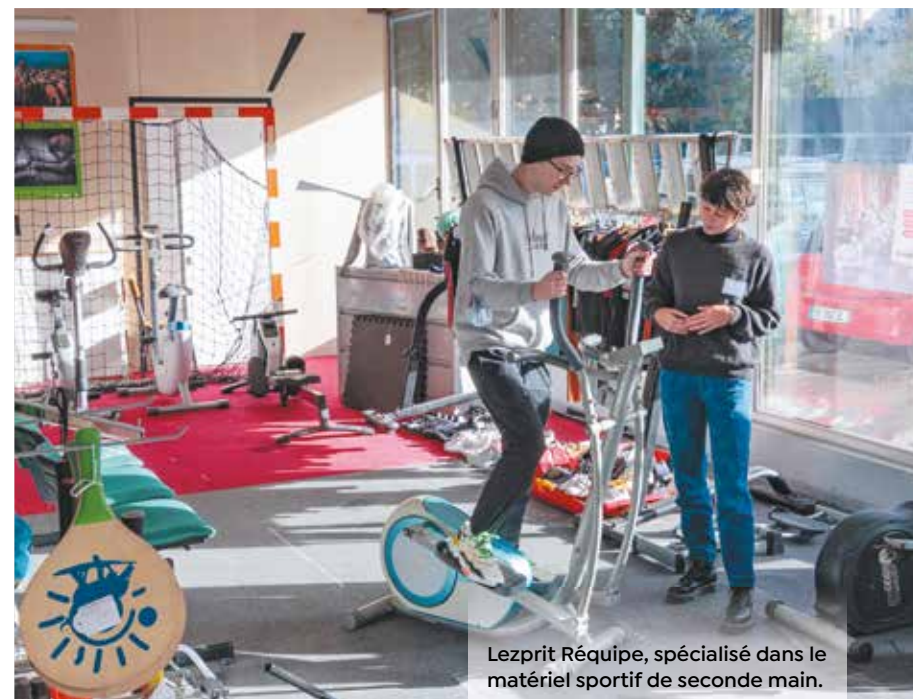
Lezprit Réquipe, spécialisé dans le matériel sportif de seconde main.