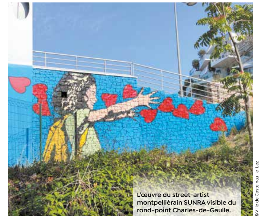
L'œuvre du street-artist montpelliérain SUNRA visible du rond-point Charles-de-Gaulle.

Aires de jeux pour petits et grands, cheminements naturels, plaine enherbée, sentiers bucoliques, espace de stationnement pour foodtruck, wifi public haut débit... Le parc des berges du Lez, dont la première phase a été inaugurée le 6 novembre près du rond-point Charles-de-Gaulle, se destine à être un lieu de vie accessible à tous les publics. Ce projet d'aménagement d'un grand parc boisé sur les berges du Lez a été amorcé à la suite d'une consultation citoyenne à la rentrée 2020. Les votants ont retenu la 3 e option proposée par le bureau d'études et d'architectes Garcia-Diaz à 73 % des suffrages. La seconde phase de requalification des berges sera engagée en 2024.